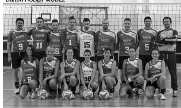
Dalton HOBBY MODEL