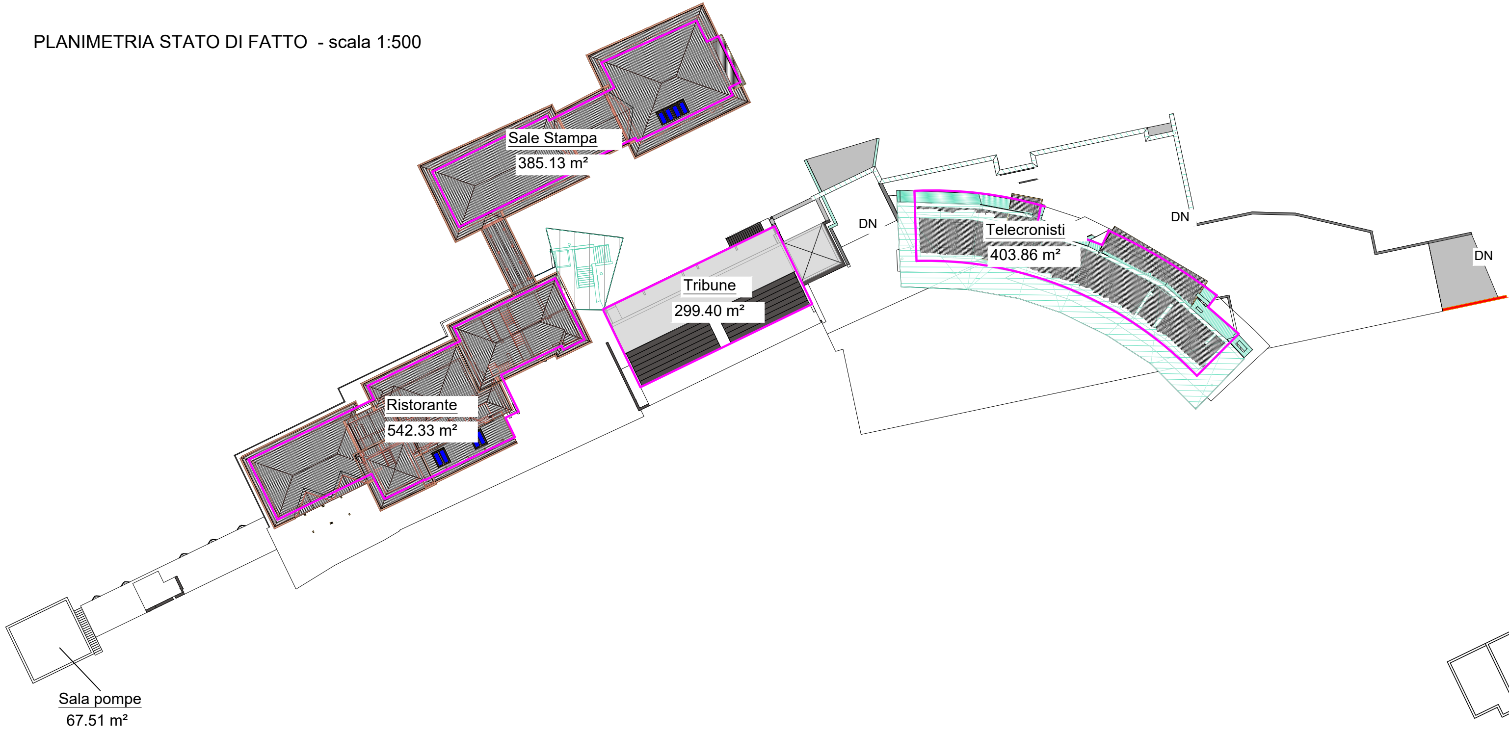
PLANIMETRIA STATO DI FATTO - scala 1:500