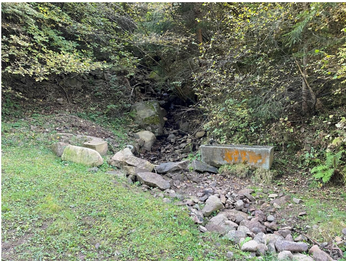
Figura 10: Rio del Maton, imbocco tubazione di attraversamento attuale della pista