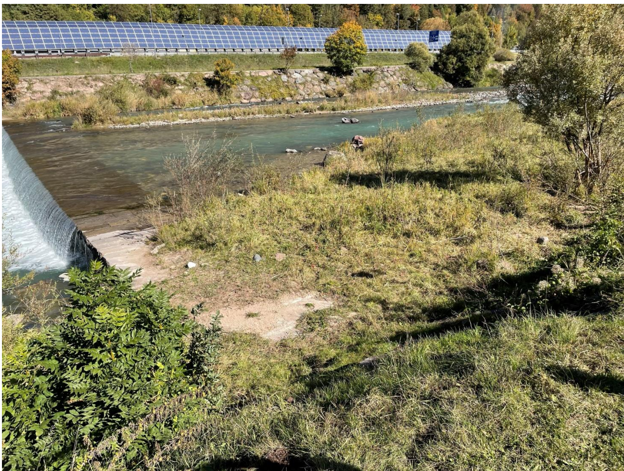
Figura 16: Zona di realizzazione nuova opera di presa sul Torrente Avisio

DI ING. FARINA GIORDANO E ING. VERONESI IVAN VIA DELLA CERVARA, 6 - 38121 TRENTO TEL. 0461 - 261202 FAX 0461 - 266290 E-MAIL INFO@PROALPE.IT