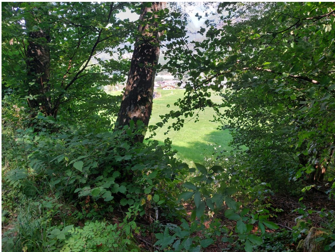
Figura 9: Tratto di intervento tracciato 3,75 km zona sud - passaggio in area boscata, zona di uscita dall'area boscata e reimmissione nei prati su terreno esistente