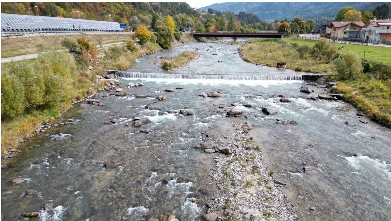
Figura 15: Briglia sul Torrene Avisio in prossimità della nuova opera di Presa