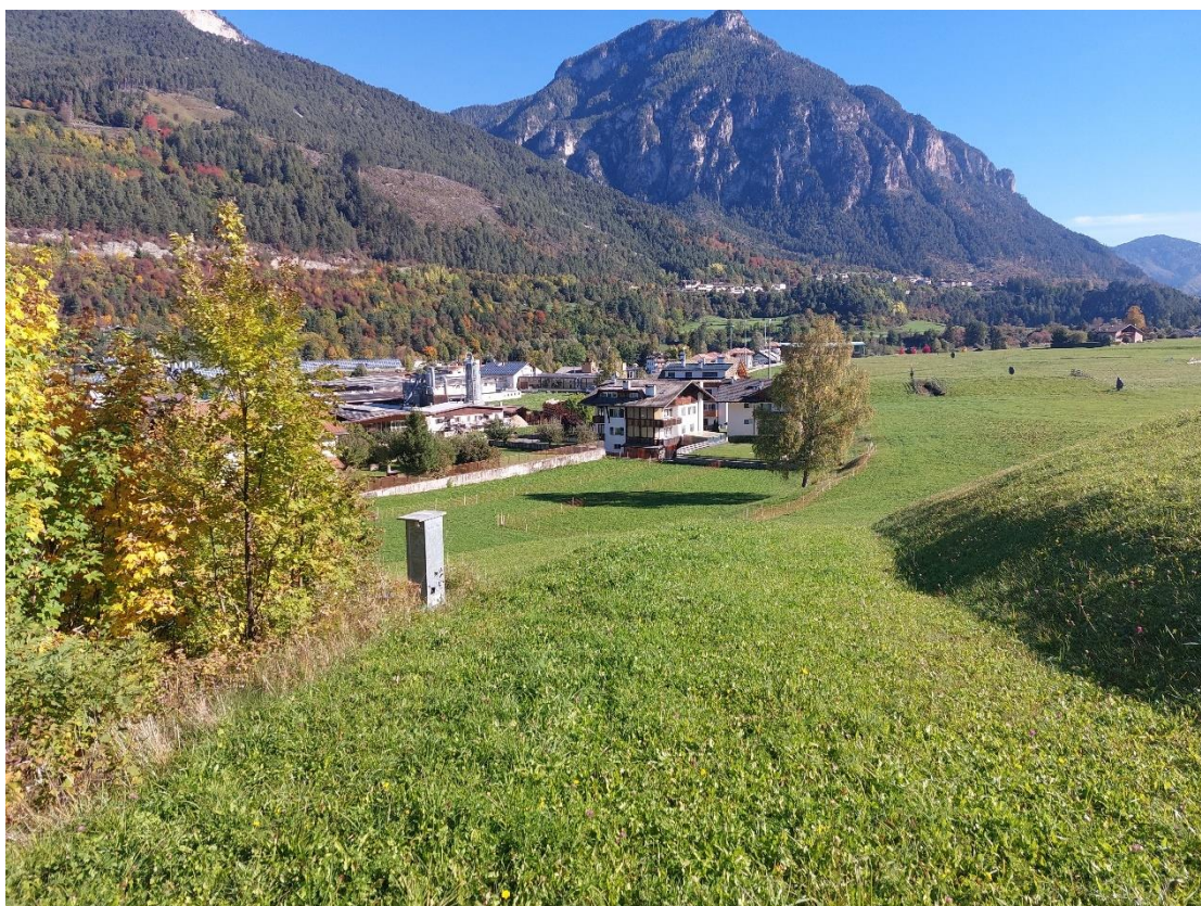
Figura 4: zona di intervento in prossimità del Rlo di Valanza – tratto terminale della discesa prima della biforcazione tra i tracciati 3,75 km libera e 5 km classica