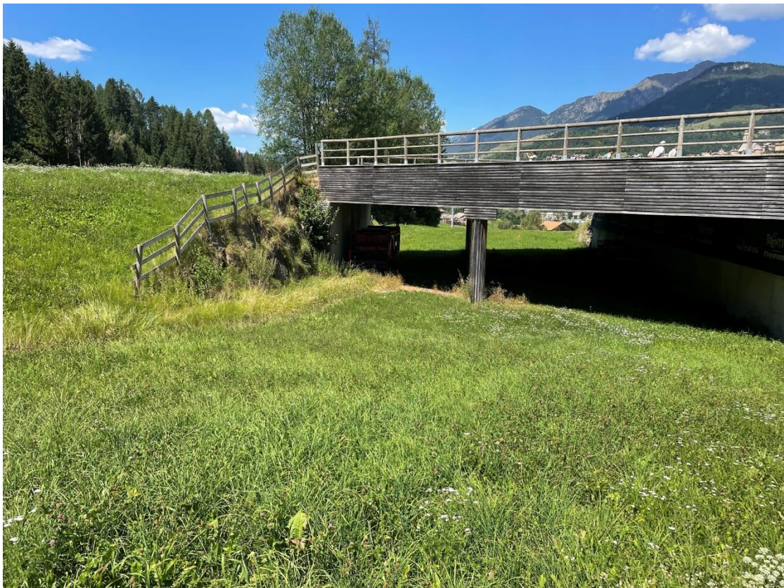
Figura 12: Ponte del quale è previsto l'allargamento