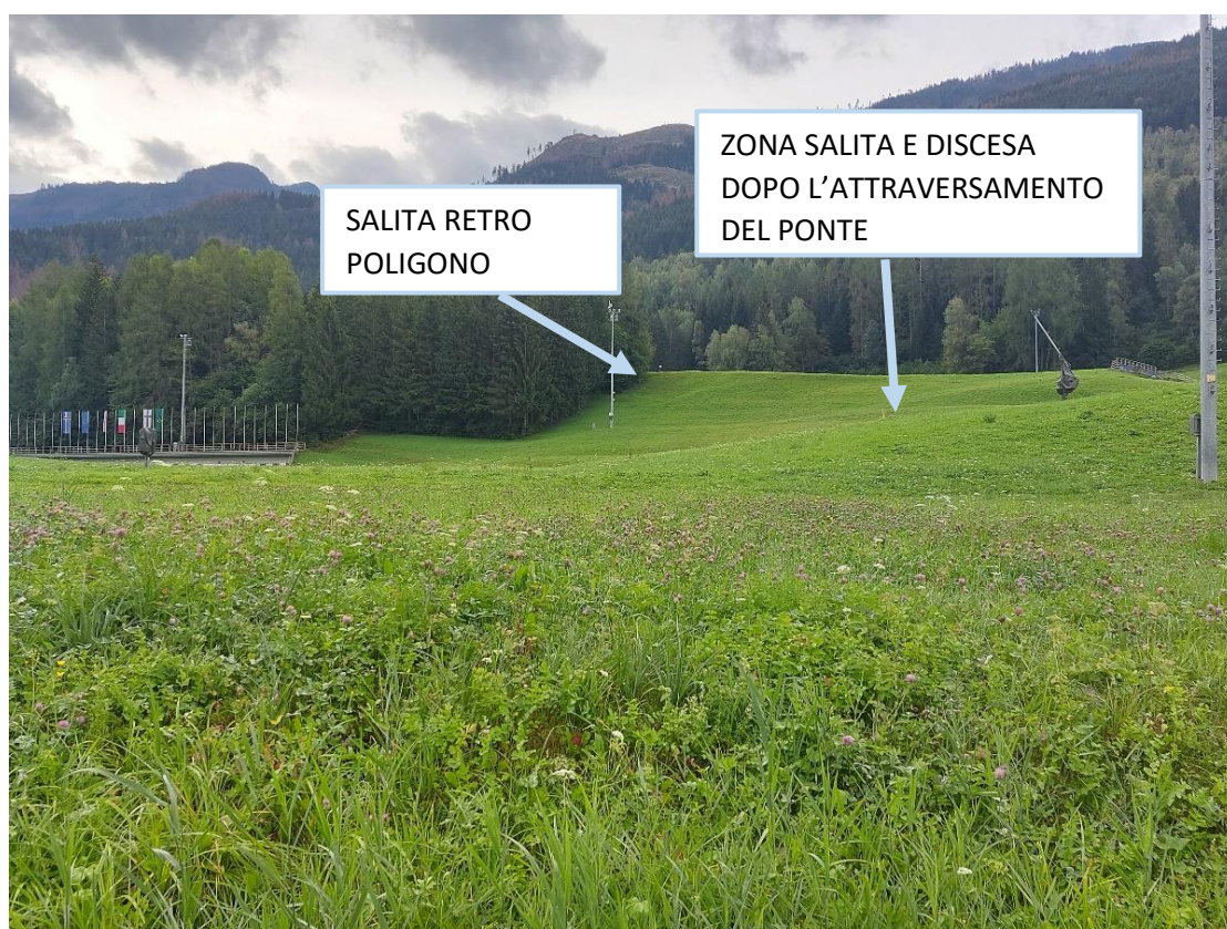
Figura 6: Tratto di intervento tracciato 3,75 km - salita retro poligono/ salita e discesa dopo l'attraversamento del ponte