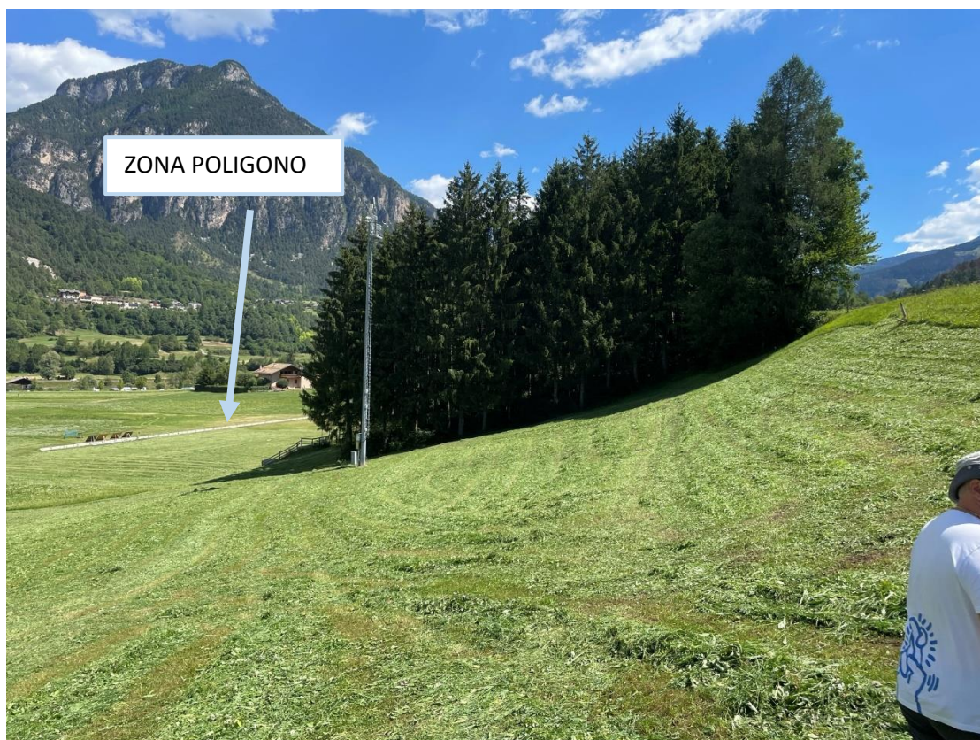
Figura 5: Tratto di intervento tracciato 3,75 km - salita retro poligono