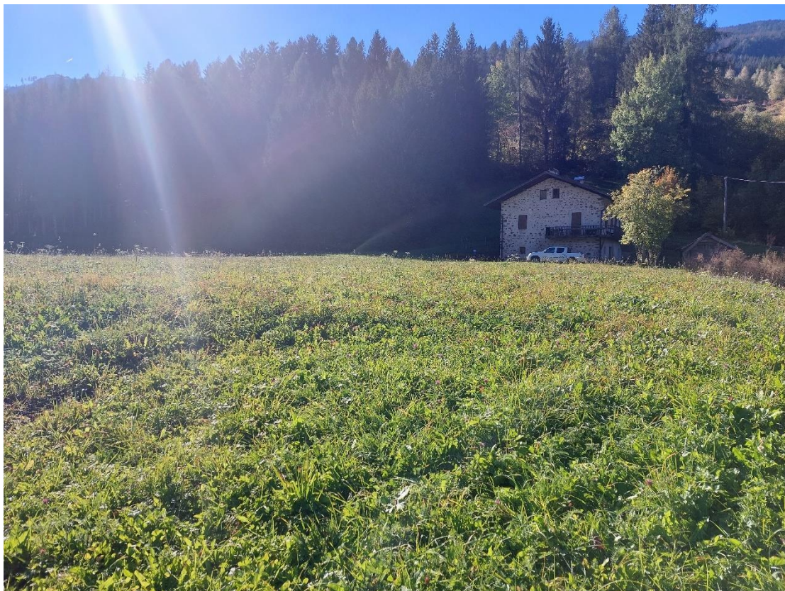
Figura 3: zona di intervento in prossimità del Rlo di Valanza – tratto dove si incontrano i tracciati 3,75 libera e 5 km classica