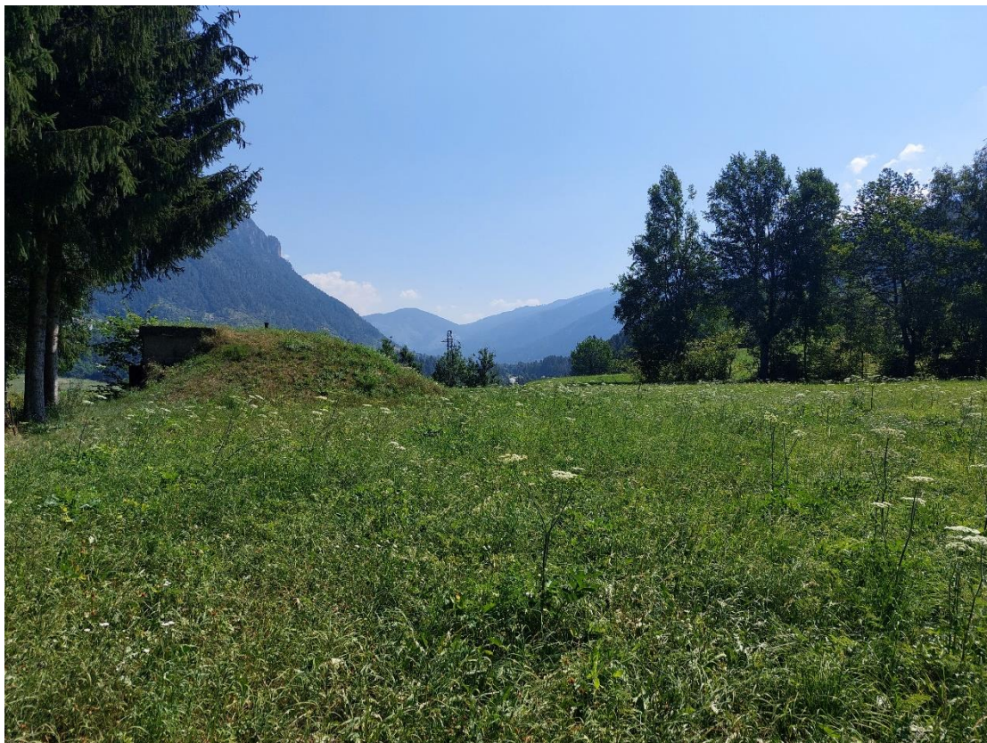
Figura 7: Tracciato 3,75 km manufatto da demolire