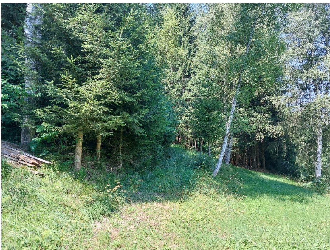
Figura 8: Tratto di intervento tracciato 3,75 km zona sud - passaggio in area boscata