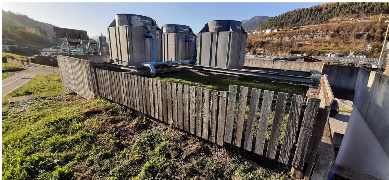
Figura 14: Torri di raffreddamento da sostituire e implementare