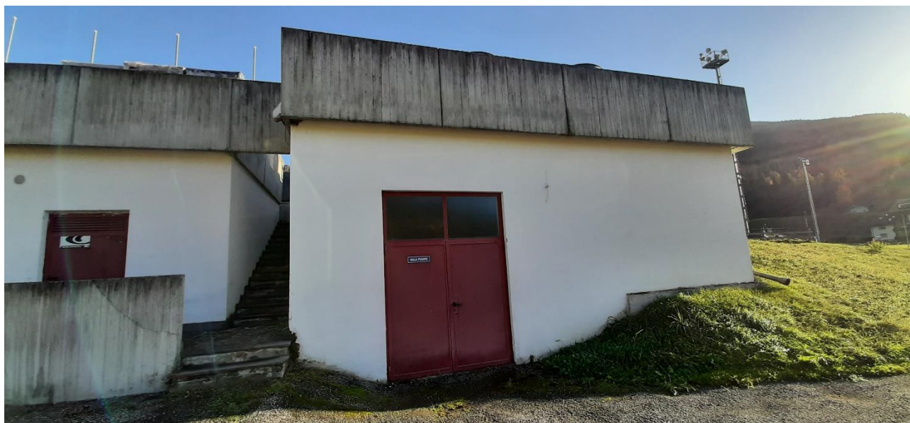
Figura 13: Sala pompe da ampliare