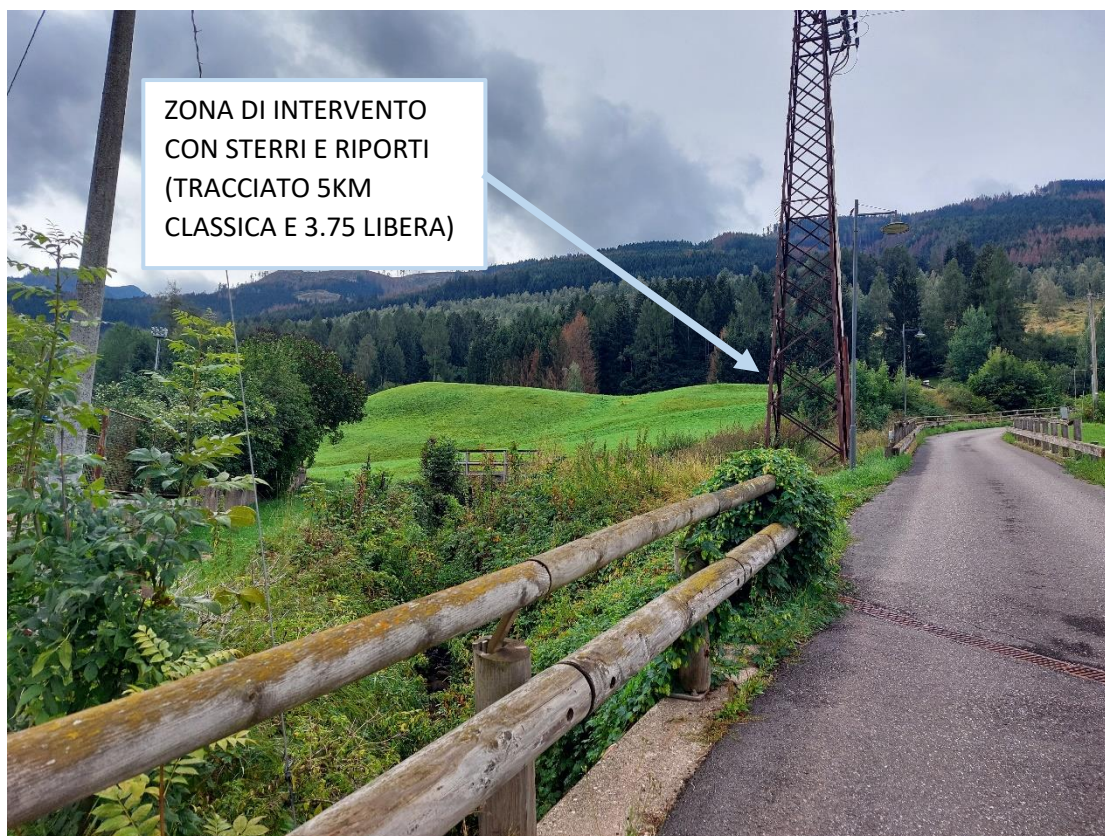
Figura 1: Vista dal ponte sovrastante il tracciato 5km tecnica classica della zona di intervento in prossimità del Rio di Valanza