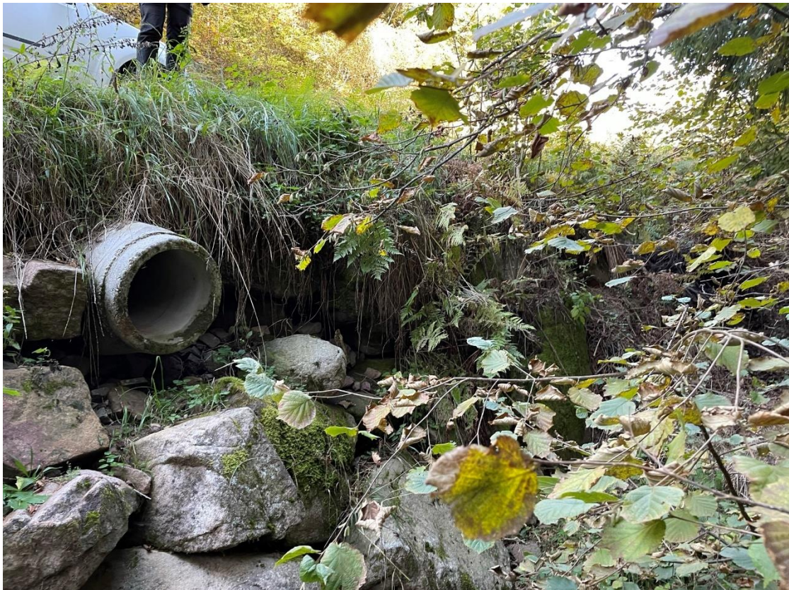
Figura 11: Rio del Maton, termine tubazione di attraversamento attuale della pista