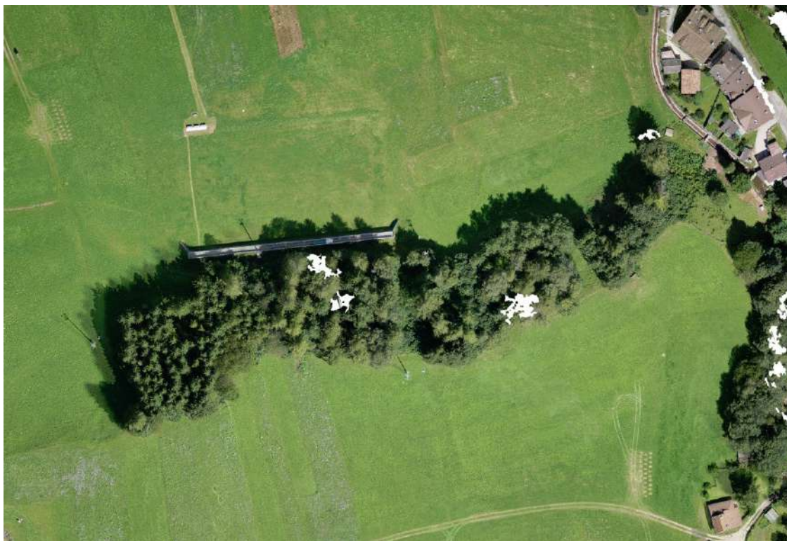
FOTO 4: Transito pista presso la p.ed. 704/1 C.C. Tesero, sez. 10;