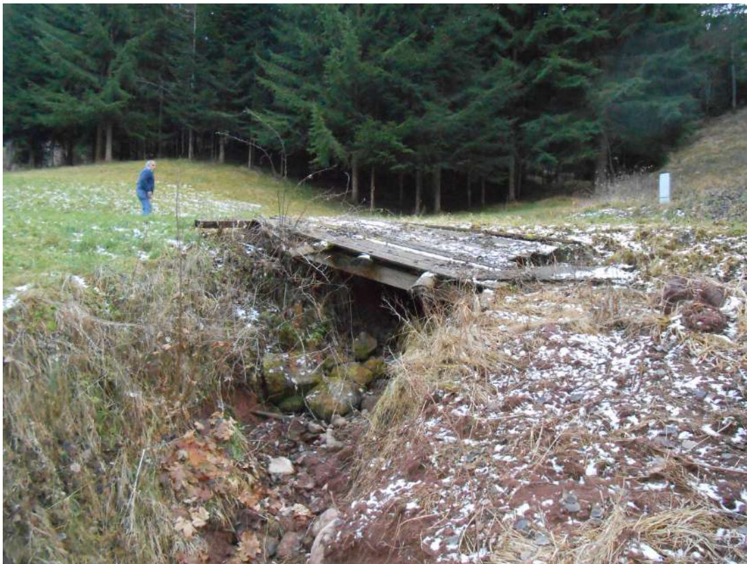
FOTO 8: Zona di transito su strada di bosco esistente dove si prevede le scogliere con fosso a monte per incanalare le acque in un pozzetto di confluenza presso sez. 14;