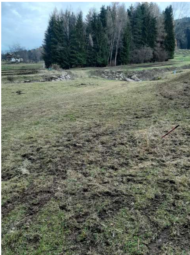
FOTO 6: Zona vista dall'alto, oggetto d'intervento di bonifica agraria presso sez. 12-A-B-C;