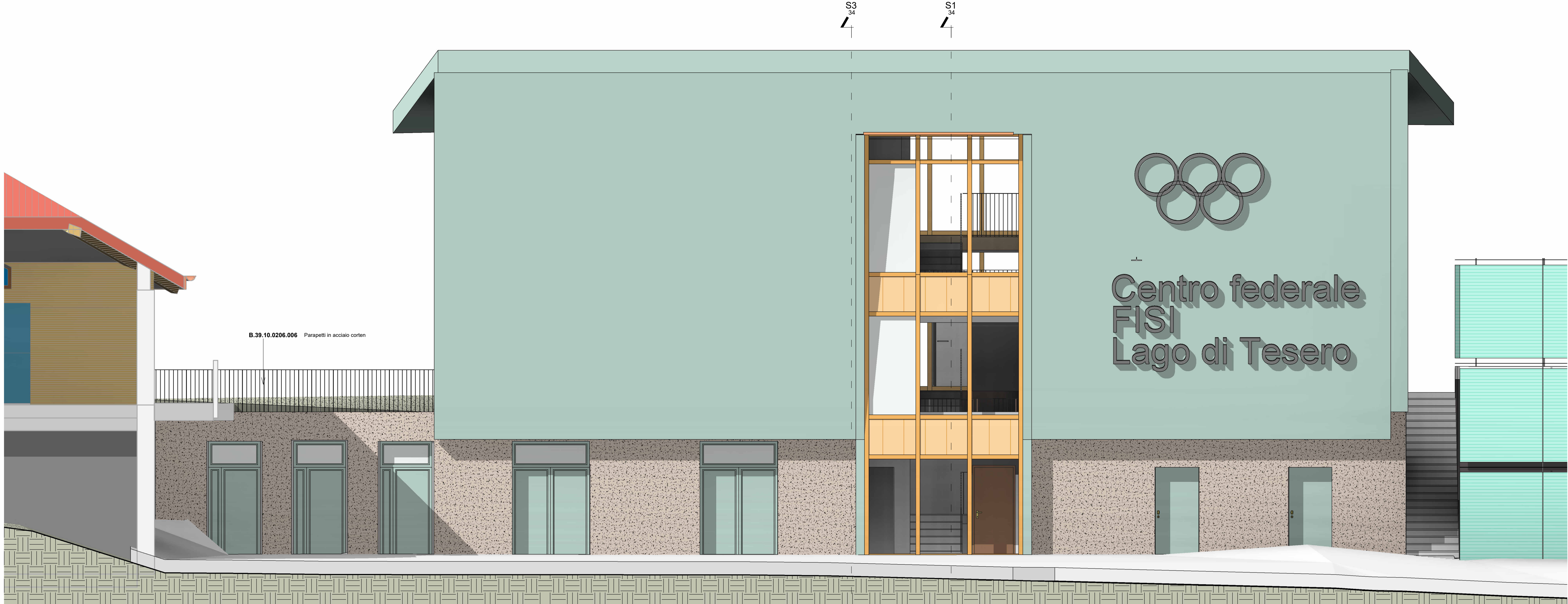
1 36 Prospetto Nord 1 : 50