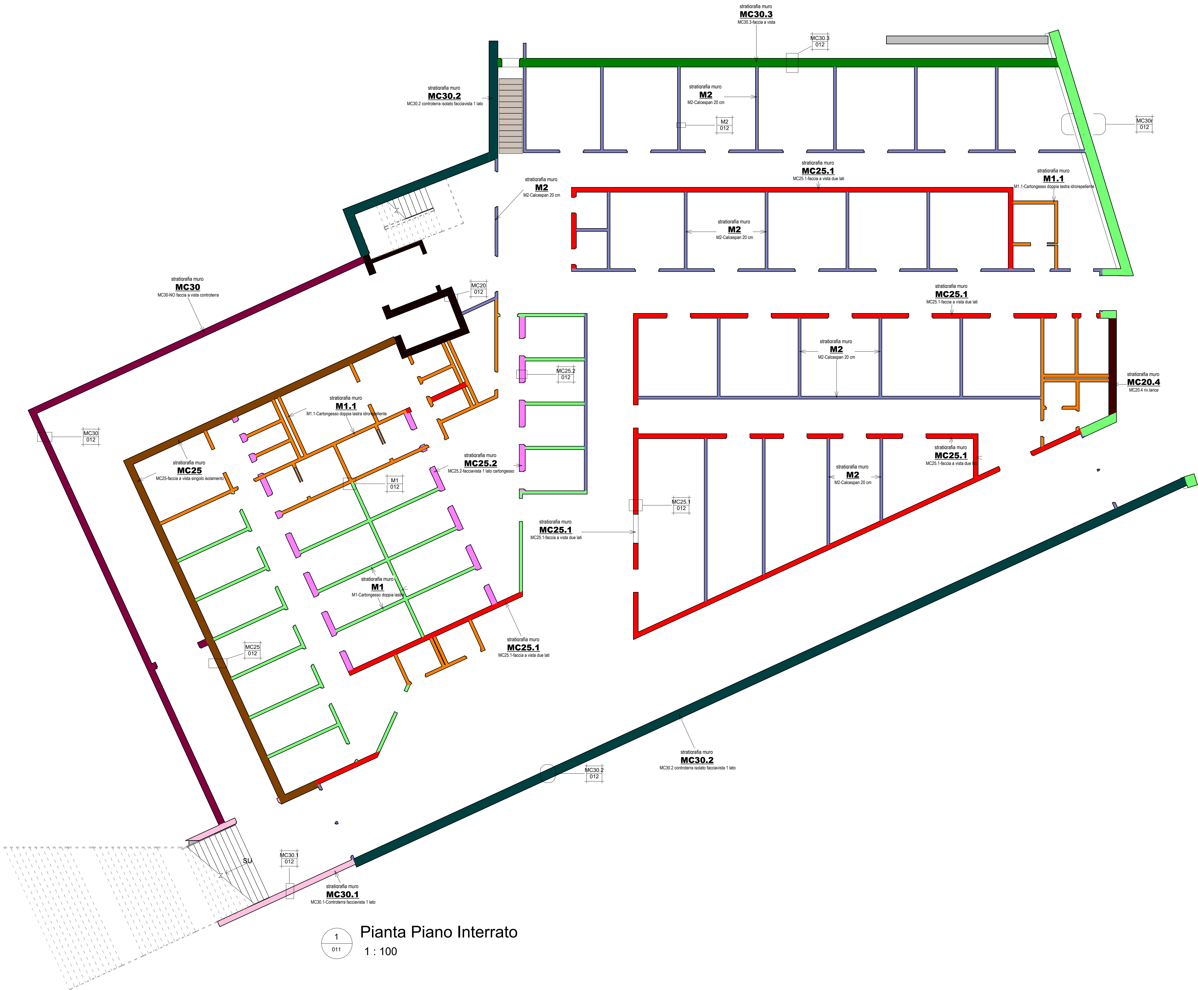
1 011 Pianta Piano Interrato 1 : 100