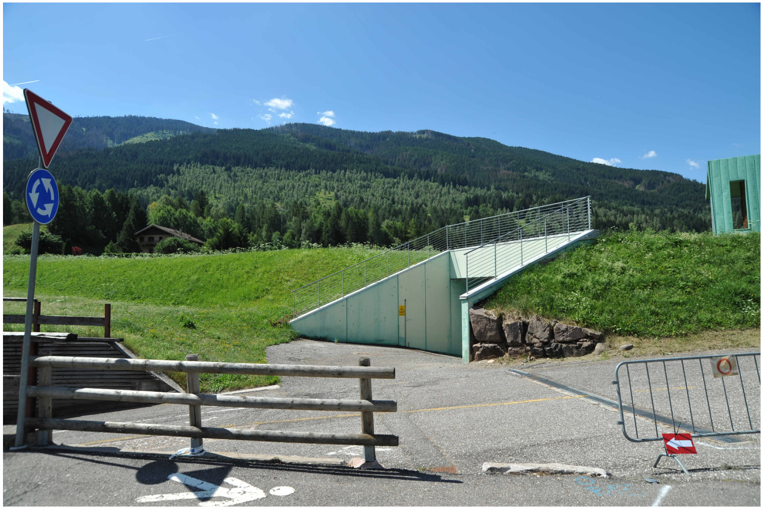
3 Foto ingresso 1 : 100